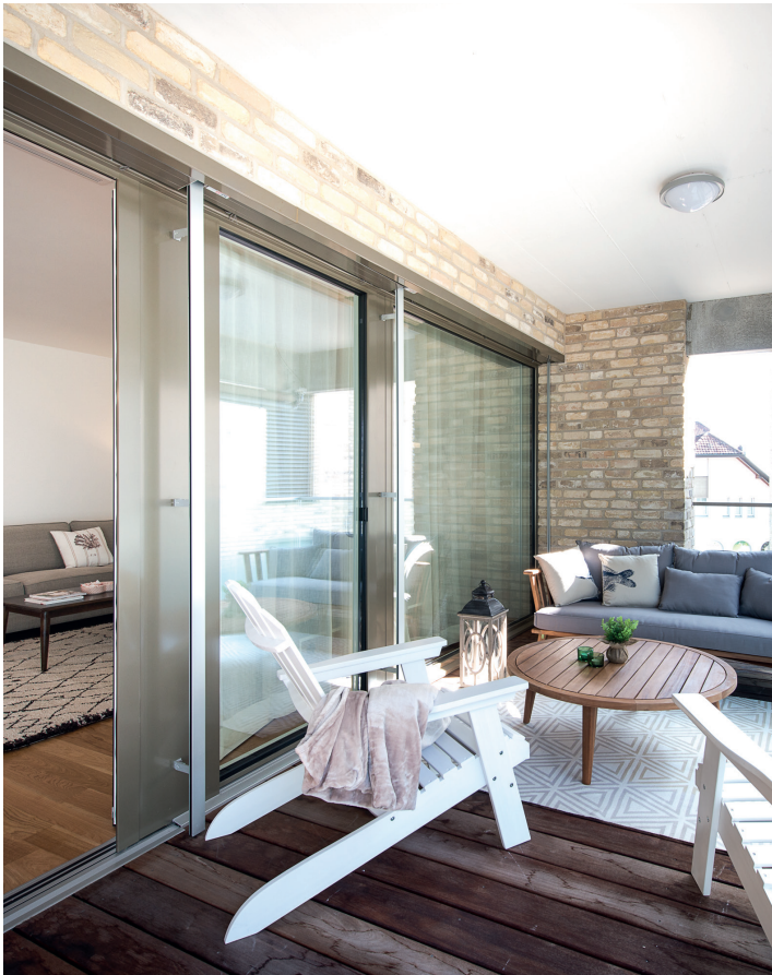
Musterwohnung im Roggenpark in Oensingen.